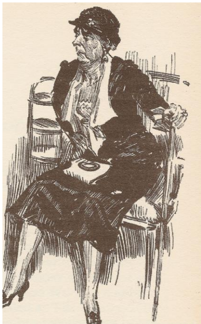
En drake: Faster Agatha Gregson, som förpestar Bertie Wooster's liv.

Följande är inte en vetenskaplig analys av kvinnoskildringarna i Wodehouses historier. Den är närmast ett kåseri med viss bakgrund i hans eget liv. I hans böcker framgår vissa mönster i hur han skildrar de äldre ”drakarna” och de yngre kvinnorna. Genomgående går hans beskrivningar av kvinnorna närmare in på deras personligheter än männens. De har djupare tankar, ofta större intelligens och bättre omdöme än männen och hamnar inte lika ofta i samma svåra situationer som drönarna. De uppvisar också mycket mera empati än männens ”kamratskap”.