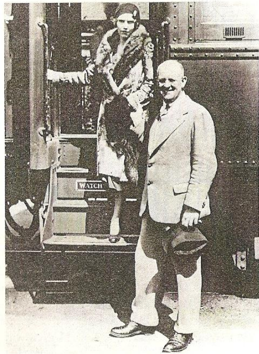
Plum anländer till Los Angeles.

I The Rise of Minna Nordstrom får vi se hur en megastjärna skapas när den uppåtsträvande Vera Prebble genom list och utpressning lyckas tvinga till sig ett filmkontrakt med garanterat stjärnstatus och artistnamnet Minna Nordstrom, Greta Garbo var redan upptaget. Hon blev dessutom den direkta orsaken till sammanslagningen av tre filmbolag till jätten Perfecto-Zizzbaum Motion Picture Corporation. Enligt McCrum är detta en i sak ganska så korrekt skildring av hur Metro-Goldwyn-Mayer bildades 1924.